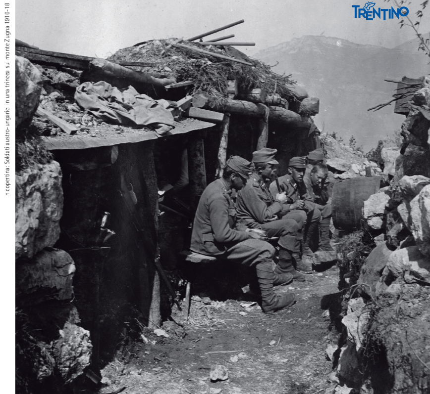
In copertina: Soldati austro-ungarici in una trincea sul monte Zugna 1916-18

Orari: da martedì a venerdì 10-13 e 14-18; sabato, domenica e festivi 10-18; chiuso lunedì non festivi, 25 dicembre e 1 gennaio